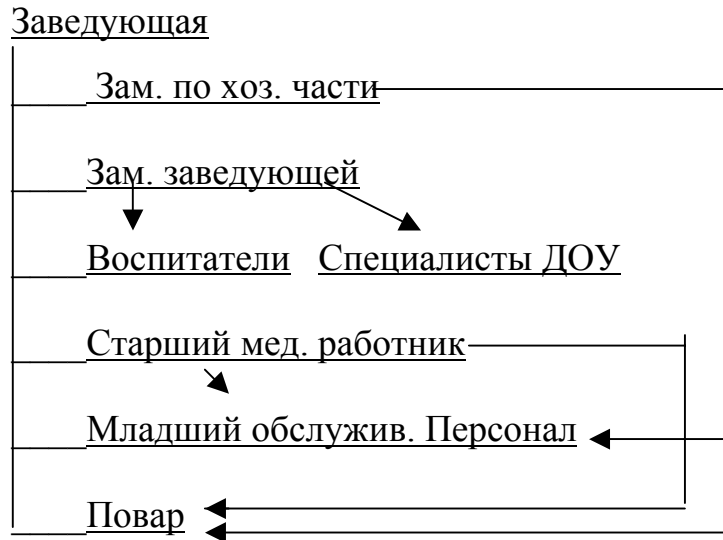
Рис. 2. Структура управления ДОУ № 102.

позволяет субъектам педагогического процесса вести совместную деятельность в форме сотрудничества, параллельного действия, последовательного содействия.