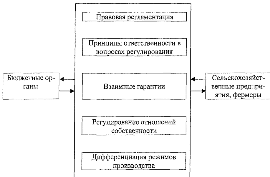
Схема 3. Механизм взаимодействия бюджетных органов и сельскохозяйственных предприятий, фермерских хозяйств

направлением экономической политики. Многообразие принимаемых управленческих решений и принципиально новые изменения в структуре бюджетных органов и сельскохозяйственных предприятий определяют современное содержание выполняемых функций каждой из сторон, которое должно вытекать из необходимости согласованного обеспечения интересов бюджетных органов и хозяйствующих субъектов. Они складываются из определенного комплекса направлений (схема 3):