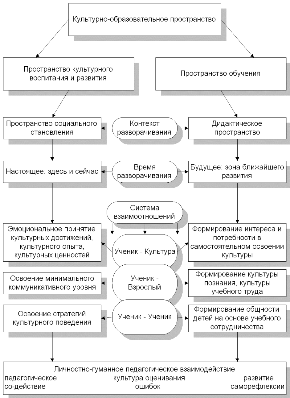
Рис. 2 Модель культурно-образовательного пространства начальной школы