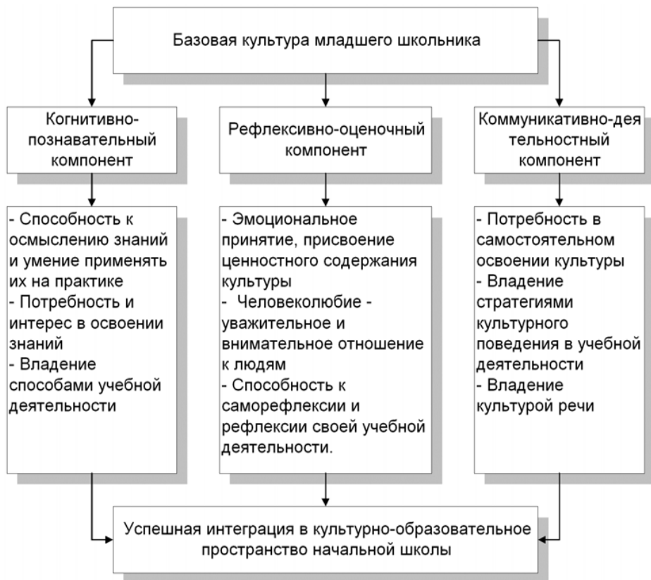
Рис. 1 Структура компонентного состава базовой культуры младшего школьника

Формирование базовой культуры младшего школьника является неотъемлемой частью начального школьного образования, цель которого – вооружить младшего школьника необходимым минимумом знаний, умений, навыков, позволяющим ему овладевать различными видами учебной деятельности, культурой общения и учебного труда. Содержание компонентов базовой культуры нашло отражение в государственном образовательном стандарте, ориентированном на подготовку к жизни личности, способной интегрироваться в культурно-образовательное пространство начальной школы.