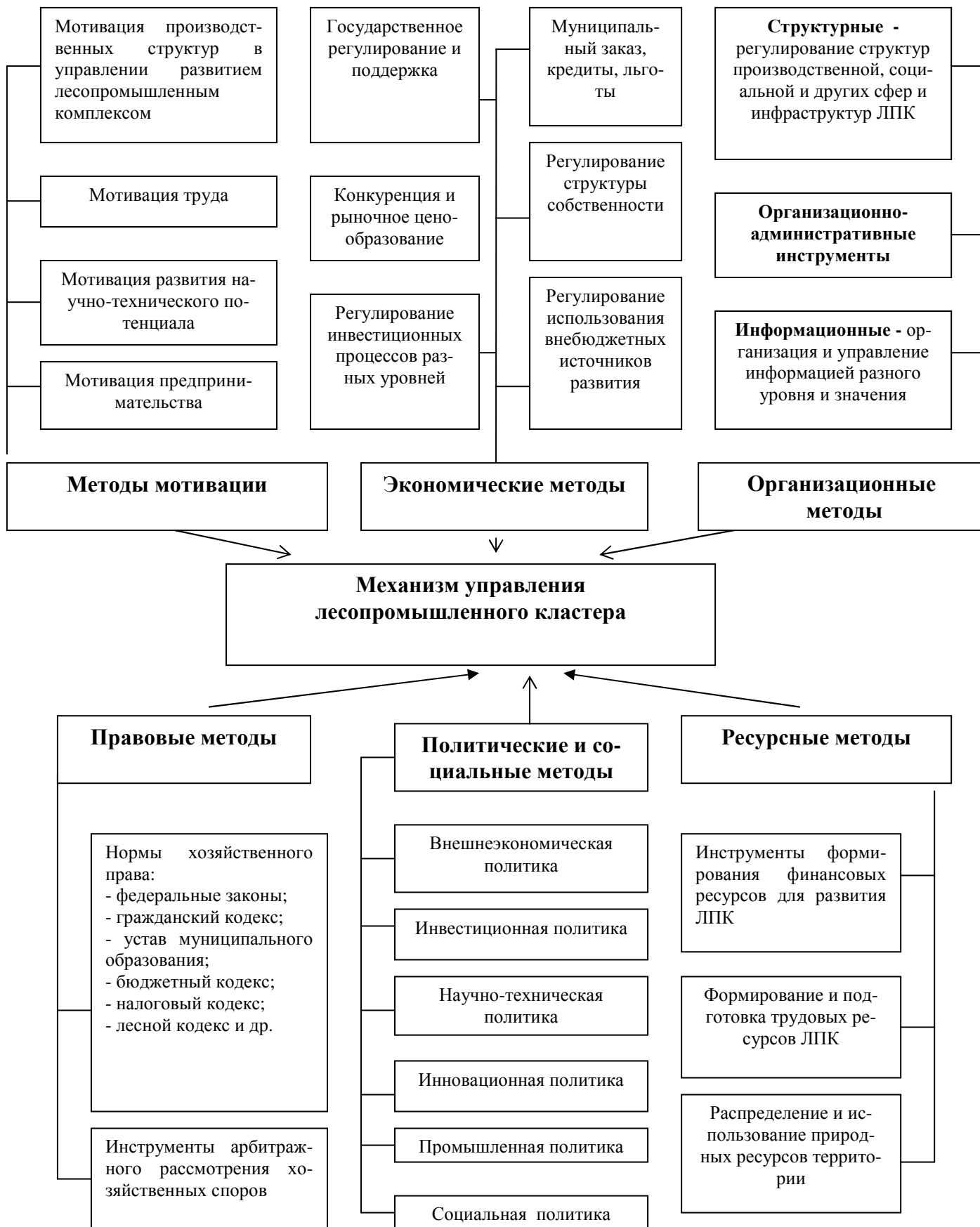
Рис. 3. Организационно-экономическая модель механизма управления развитием регионального ЛПК