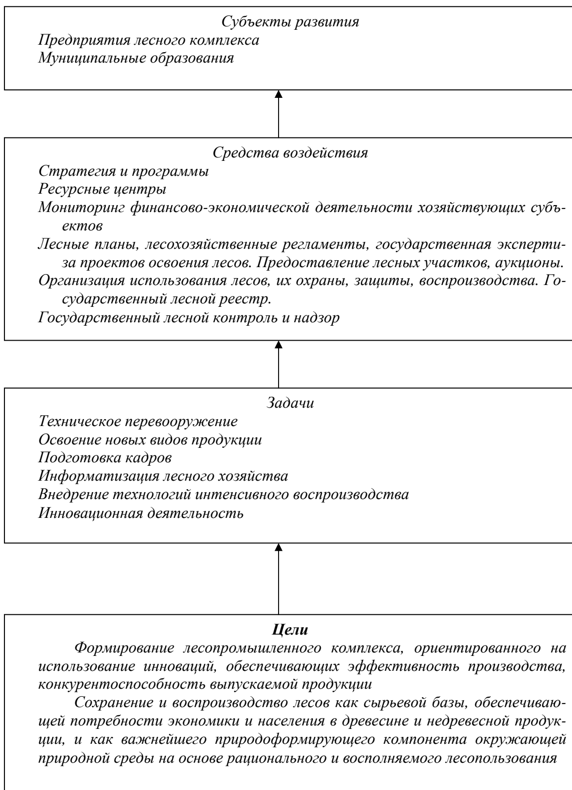
Рис.1. Схема развития лесопромышленного комплекса Удмуртской Республики

- перечень функций управления определяют непосредственные учредители, которые формируют хозяйственные задачи на тот или иной период