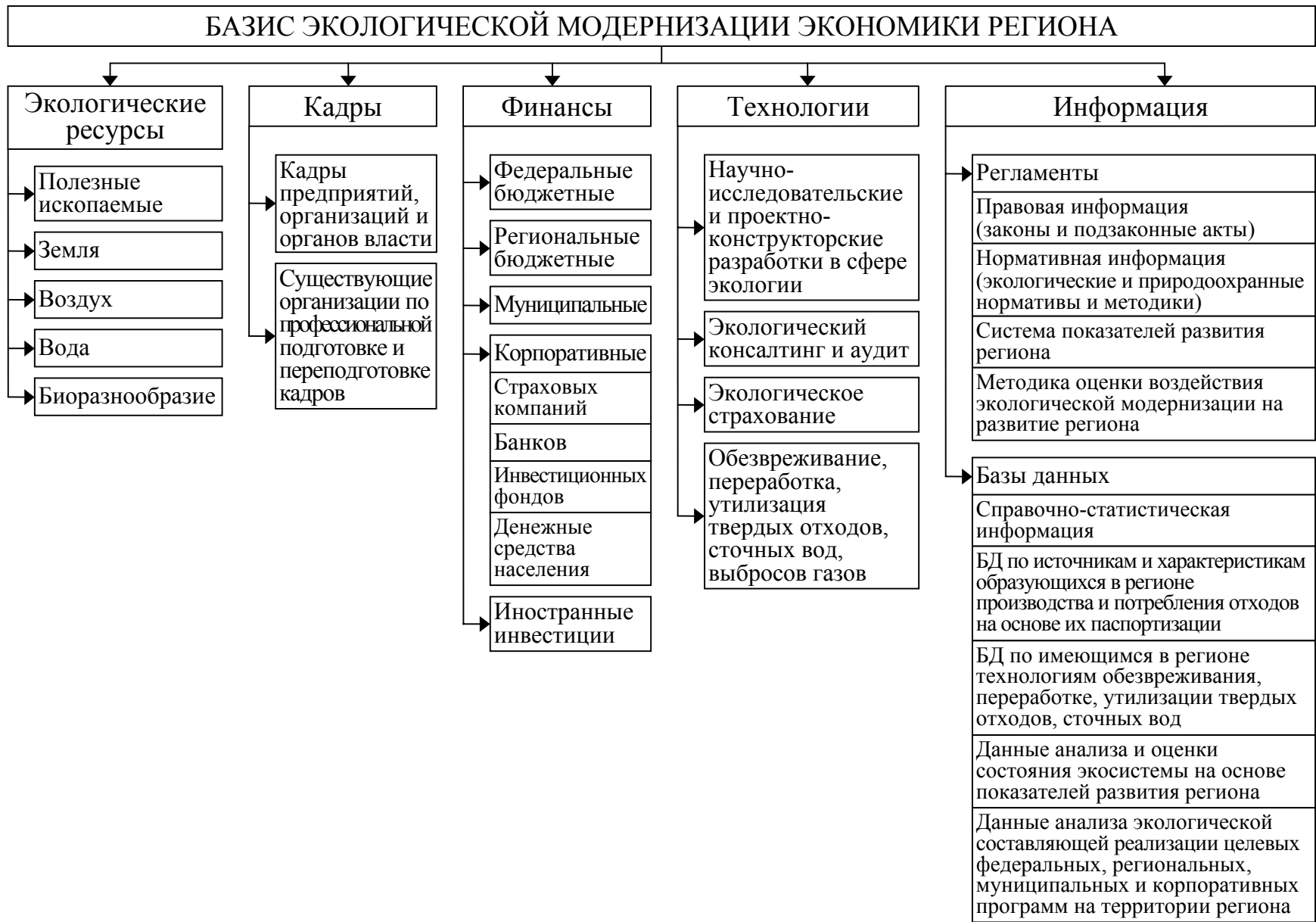
Рис. 1. Базис экологической модернизации экономики региона