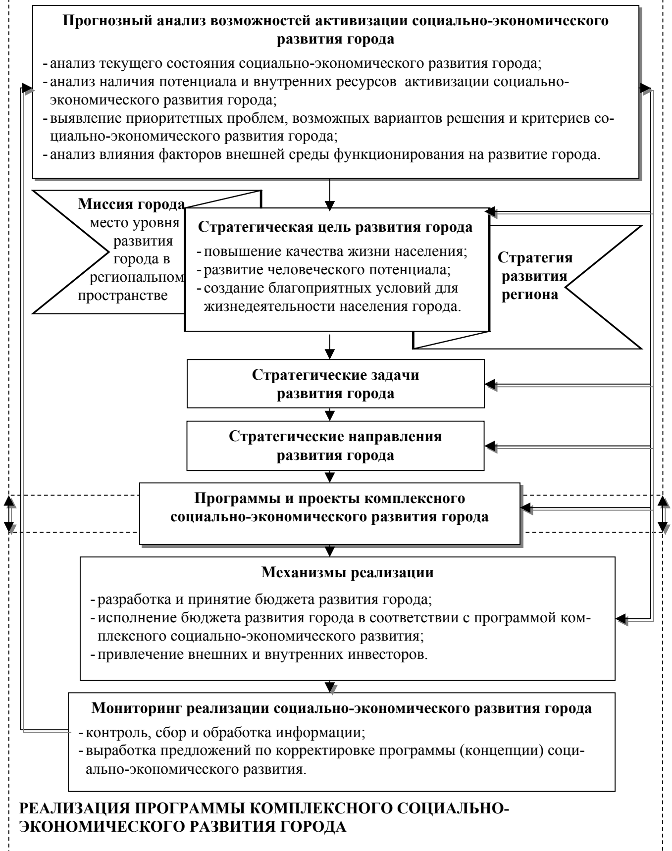
Рис.2. Алгоритм разработки стратегии активизации комплексного социально-экономического развития малых и средних городов