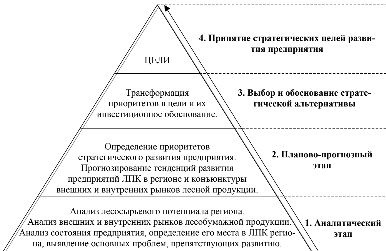
Рис. 3. Методика обоснования стратегических целей развития предприятия регионального лесопромышленного комплекса

Полученные в результате проведенного комплексного анализа состояния и уровня развития предприятия ЛПК данные позволят сформировать целостную картину состояния предприятия и, если это необходимо, отрасли в целом, с целью анализа необходимости формулировки новых либо корректировки принятых стратегических целей развития предприятия регионального лесопромышленного комплекса.