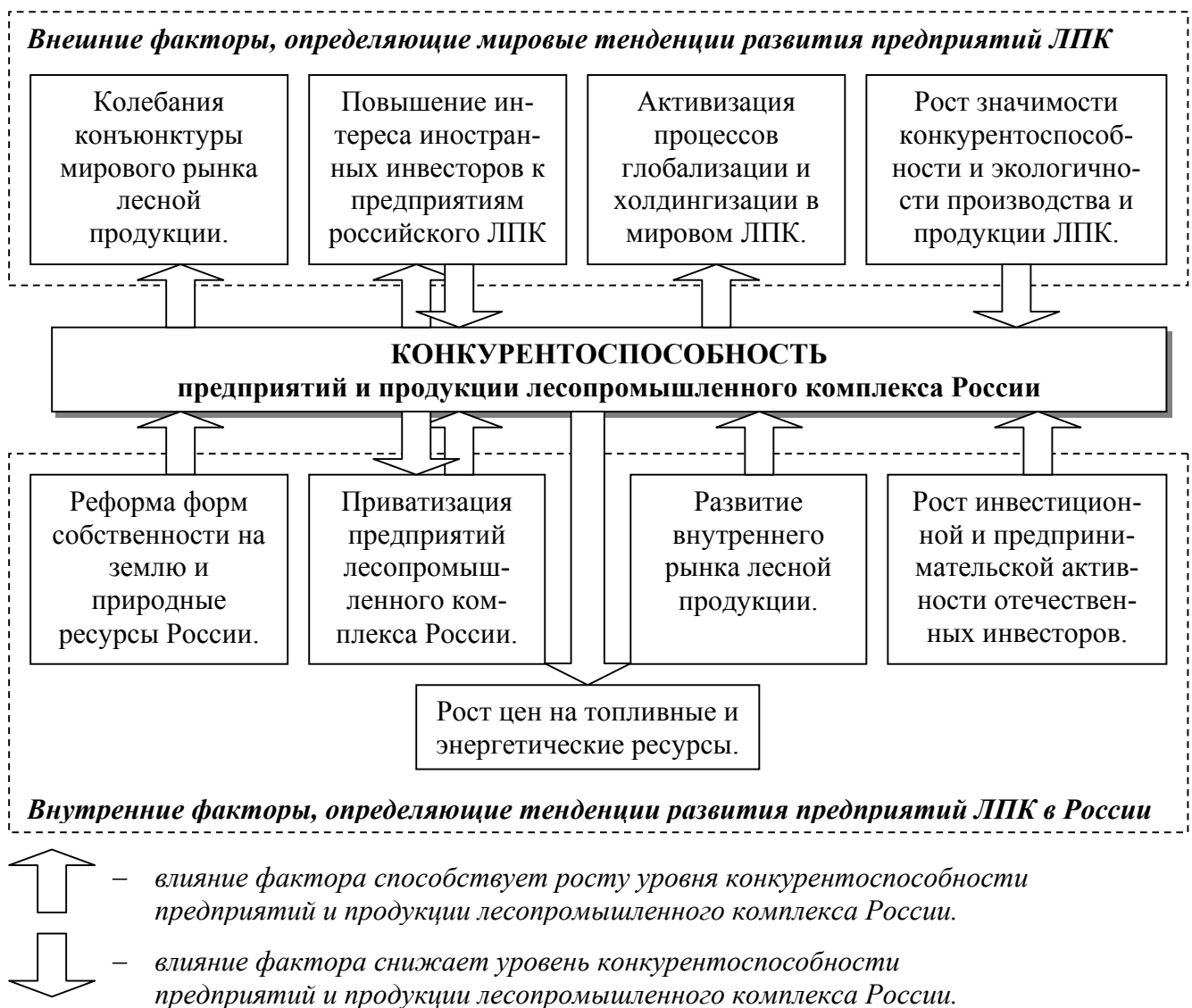
Рис.1. Влияние факторов рыночной среды на уровень конкурентоспособности предприятий и продукции лесопромышленного комплекса России

На рис.1 представлены факторы рыночной среды, оказывающие определяющее влияние на уровень конкурентоспособности предприятий и продукции лесопромышленного комплекса России.