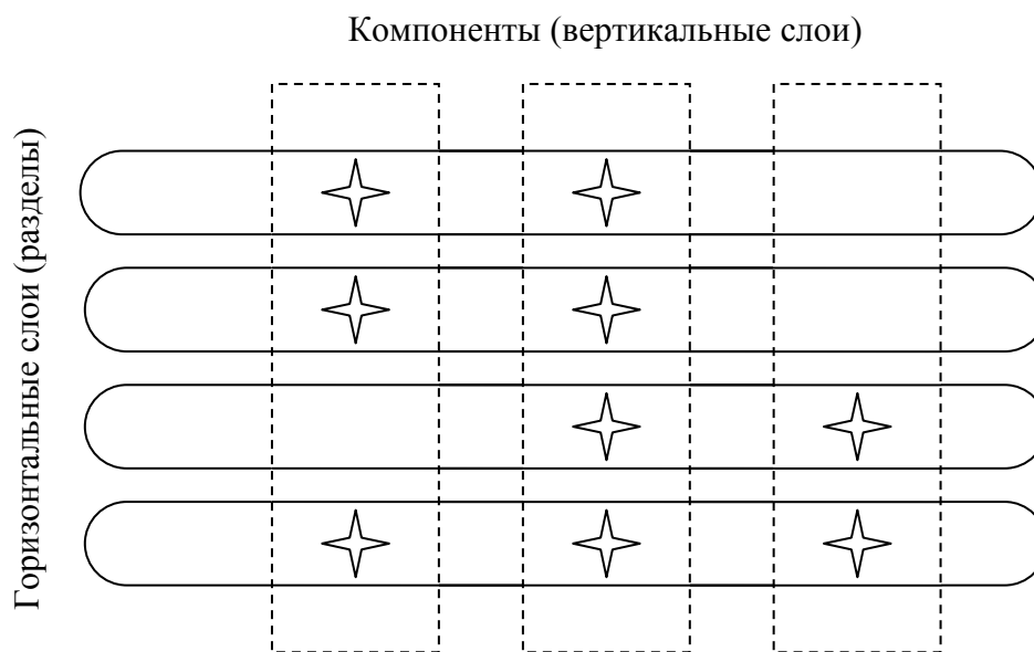
Рис. 2. «Квадратно-гнездовая» схема структуры региональной целевой программы

Общая структура программы изображается в виде «квадратно-гнездовой» схемы (рис. 2), где горизонтальными овалами представлены горизонтальные слои (разделы программы), пунктирными прямоугольниками — компоненты, а их пересечением является программный модуль (модули). На рисунке 2 названия модулей не приведены, а лишь отмечены звездочками те составляющие слоев, которые действительно присутствуют в программе. Дело в том, что компонент, разумеется, вовсе не обязан присутствовать во всех горизонтальных слоях, и для сложной программы матрица модулей, подобная рисунку 2, может оказаться довольно-таки разреженной.