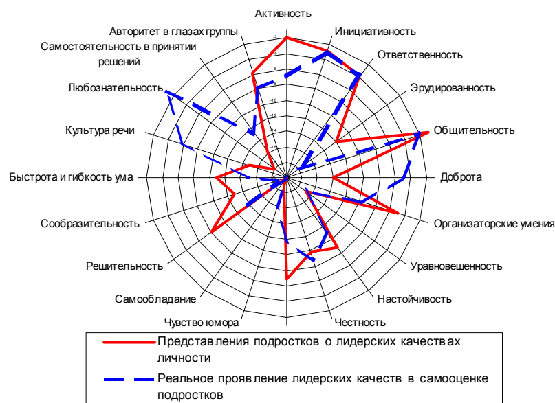
Рис. 1 Профили идеального и реального лидера в самооценке подростков – членов детских общественных объединений

В целом отметим, что подростки указали на недостаточную сформированность у них следующих качеств: настойчивость, уверенность в себе, решительность, сообразительность, общительность, активность, эрудированность, организаторские умения, авторитет в глазах группы. На первом месте среди реально проявляемых лидерских качеств названо качество «любознательность». Если в идеальном представлении оно стоит на 18 месте, то в реальном проявлении занимает первое. На второе и третье место в целом по выборке подростки ставят такие качества, как общительность и инициативность.