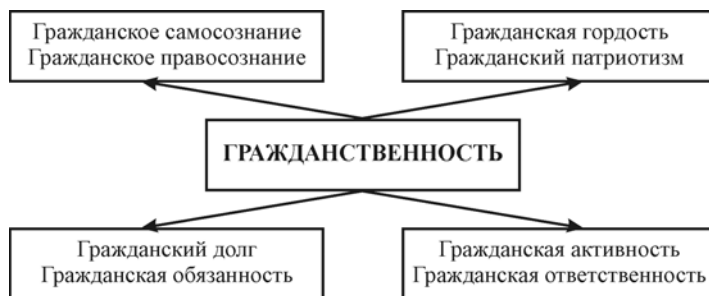
Рис. 1. Гражданские добродетели 1

В ходе исследования мы исходили из того, что требования к терминологическому аппарату науки предполагают точность и однозначность терминов, однако не отменяют возможность многоаспектного освещения явления. В нашем случае – это «гражданское воспитание», «воспитание гражданина». Для уточнения термина в диссертации вычленены различные аспекты анализа понятий и произведено уточнение их для более удобного использования в работе.