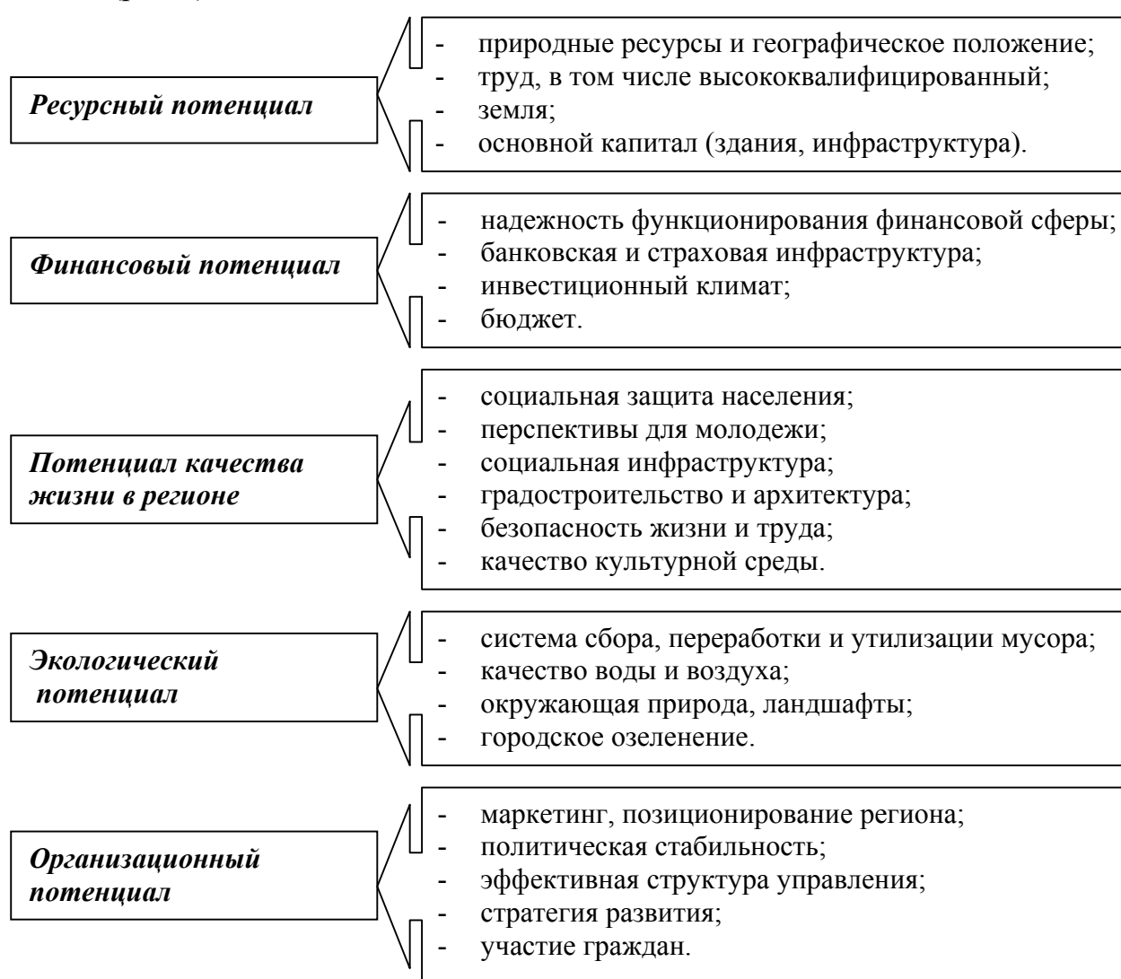
Рис. 1. Структура конкурентного потенциала региона

Конкурентный потенциал региона – комплексное понятие, включающее в себя определенные совокупности потенциалов региона, в зависимости от особенностей развития территории региона, а также соответствующих механизмов и времени их вовлечения в хозяйственный оборот с целью повышения уровня конкурентоспособности и социально-экономического развития региона. Таким образом, понятие «конкурентный потенциал региона» сложное понятие, включающее все лидерские компоненты воспроизводства на региональном уровне с учетом не только его осуществления в настоящее время, но также возможностей интенсификации его в перспективе, и включающее в себя, по нашему мнению, пять основных составляющих, являющихся основными факторами конкурентоспособности региона (рис.1).