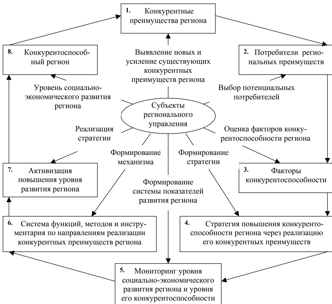
Рис. 4. Комплексный механизм реализации конкурентных преимуществ региона

На первом этапе осуществляется выявление и оценка имеющихся конкурентных преимуществ региона с целью дальнейшего их усиления и реализации.