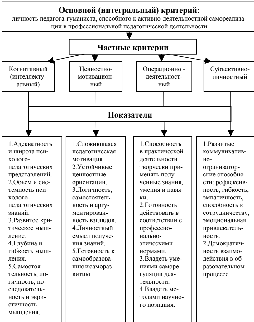
Рис. 2. Схема системы критериев и показателей оценки психолого-педагогической подготовки выпускников педагогического колледжа

тального исследования, проведен сравнительный анализ итогов обучения студентов педагогического колледжа контрольной и экспериментальной групп по критериям и показателям качества психолого-педагогической подготовки студентов для проверки эффективности