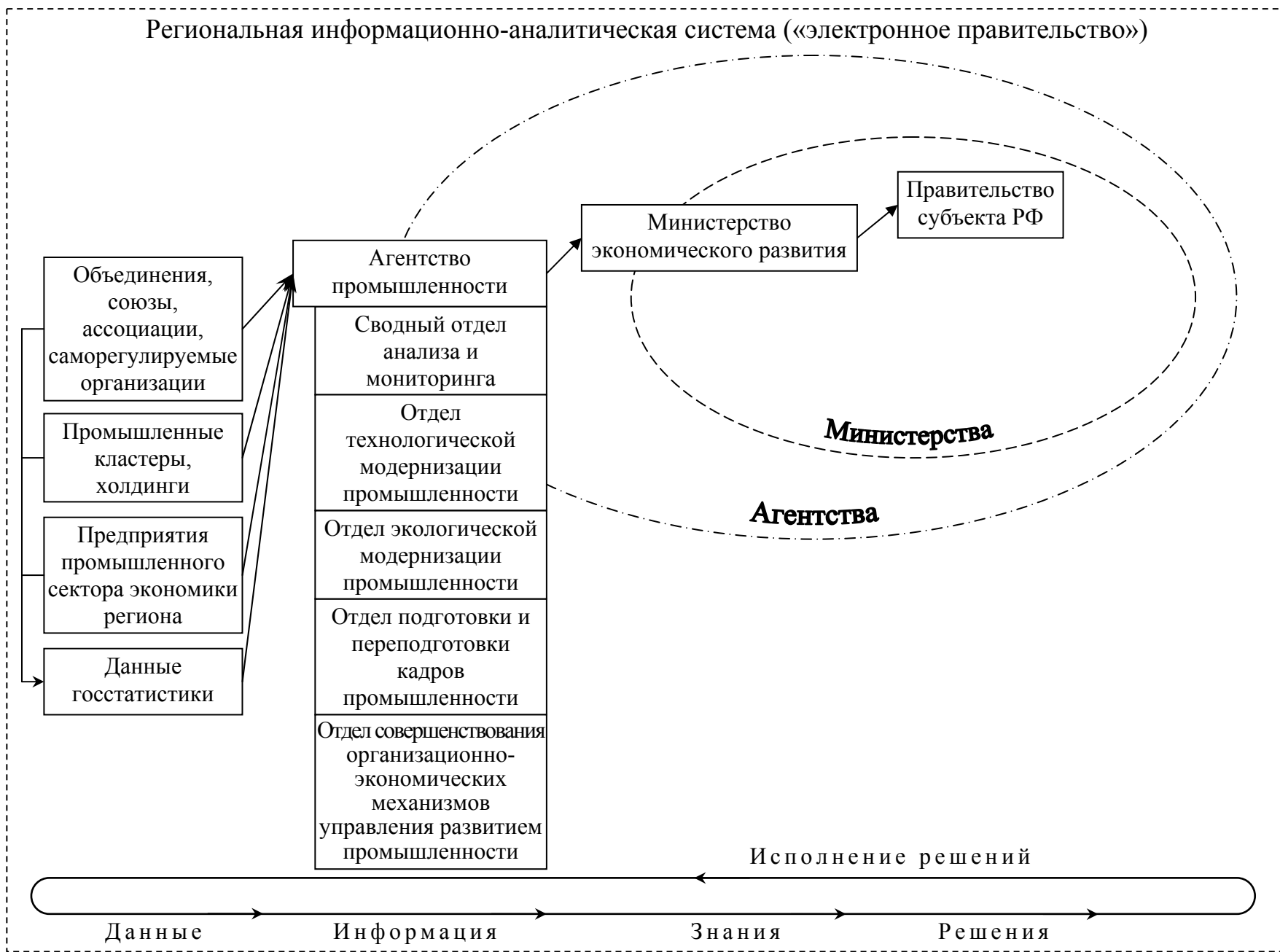
Рис. 4. Компонент управления развитием промышленного сектора экономики региональной информационно-аналитической системы