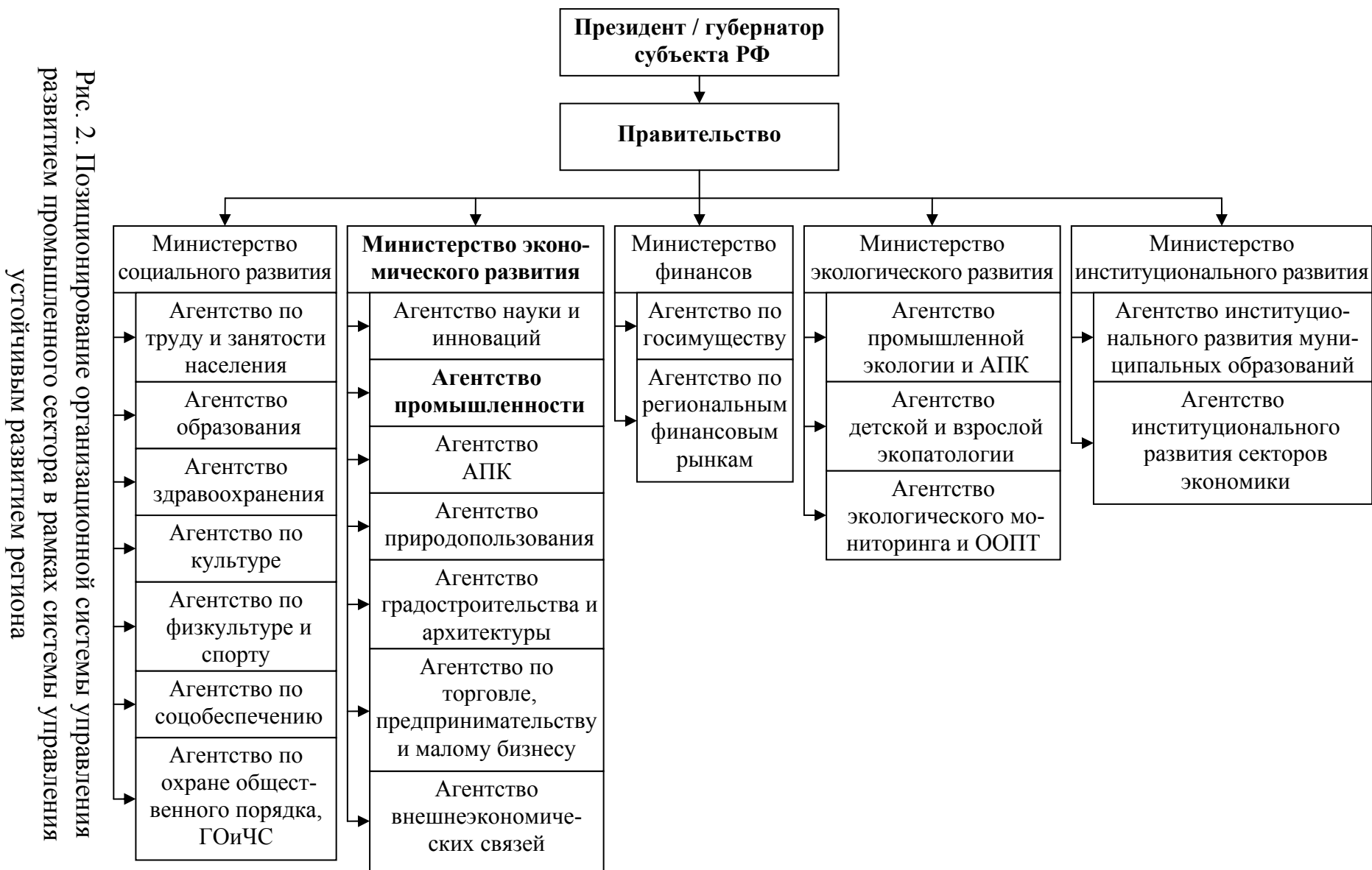
Рис. 2. Позиционирование организационной системы управления развитием промышленного сектора в рамках системы управления устойчивым развитием региона