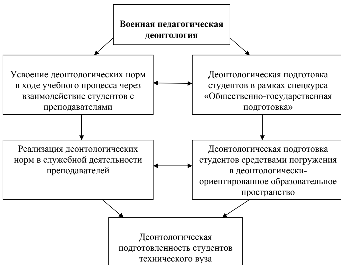
Рисунок 1. Структура деонтологической подготовки студентов на военной кафедре

Деонтологические нормы субъектов учебно-воспитательного процесса на военной кафедре представляют собой нравственно-этические требования, заключающиеся в их обязательном соблюдении и применении в ходе учебной и служебной деятельности, к ним отнесены: