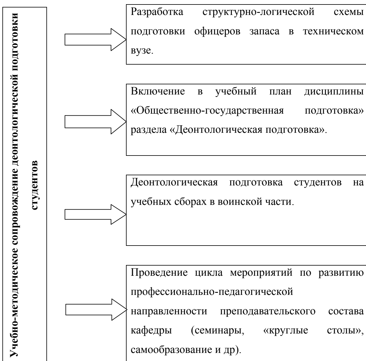
Схема 1. Модель деонтологической подготовки студентов на военной кафедре в техническом вузе

В исследовании показано, что в условиях возрастающих требований к профессионализму специалистов возникает проблема организации деонтологической подготовки студентов, будущих офицеров запаса, направленной на формирование и развитие интереса к данной области знания. Решение данной проблемы предпринято при разработке модели деонтологической подготовки студентов, обучающихся на военной кафедре (См. схему 1).