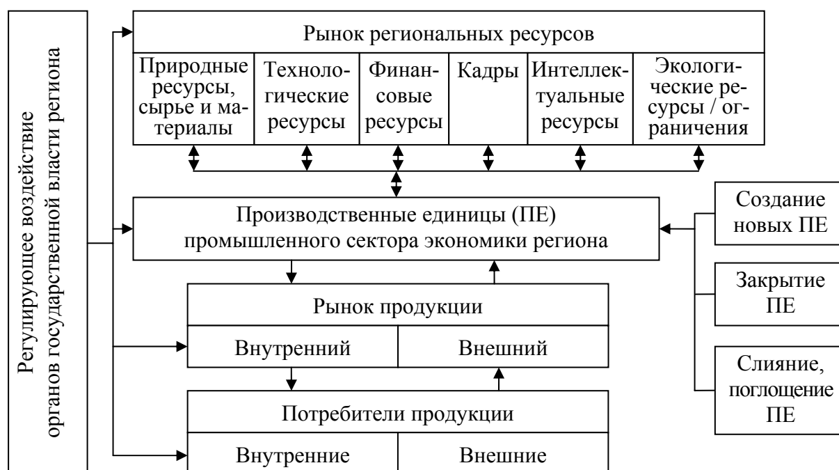
Рис. 1. Структурная модель формирования ценовых цепочек промышленного сектора экономики региона

В обобщенном виде формирование ценовых цепочек промышленного сектора экономики региона может быть представлено следующей структурной моделью (рис. 1).