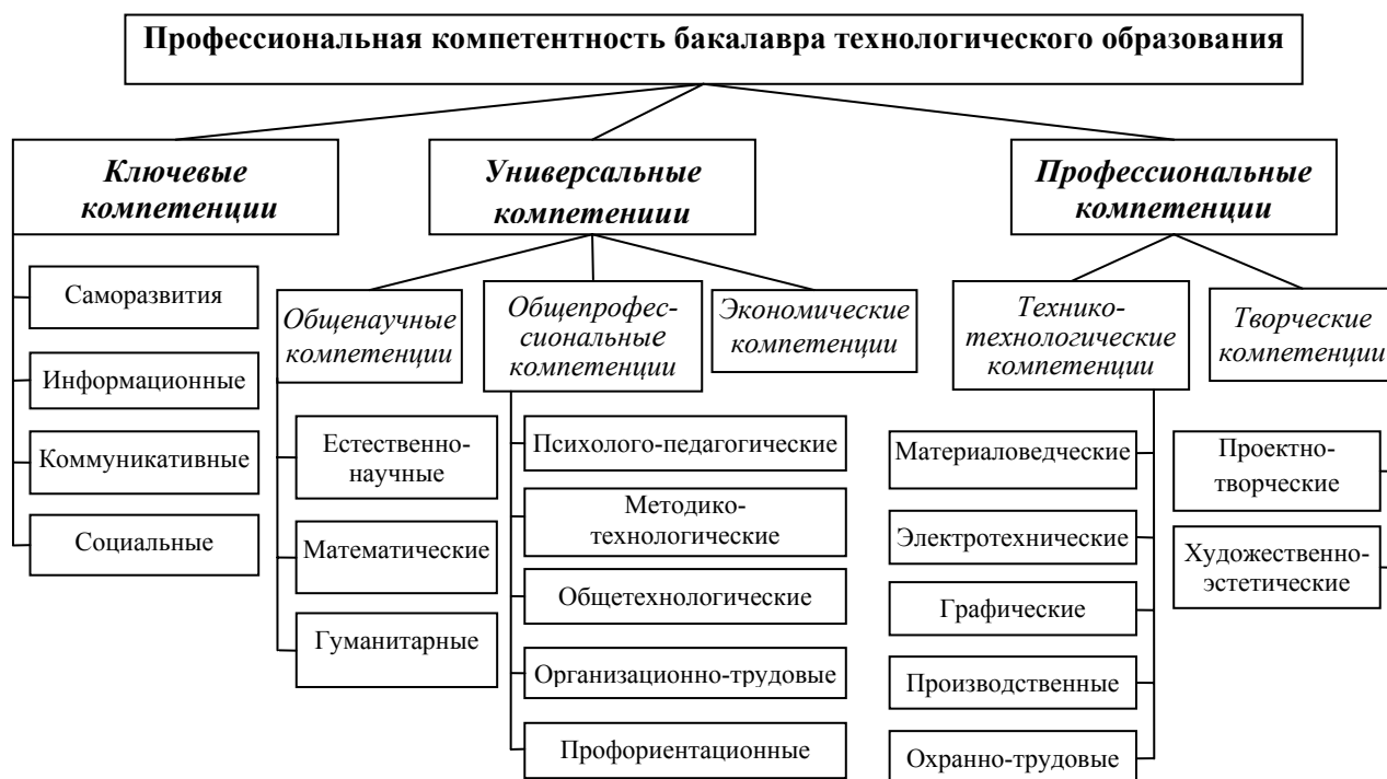
Рис. 3. Компетентностная модель бакалавра технологического образования

Компетентностная модель бакалавра технологического образования, разработанная с учетом мнений работодателей и представителей академического сообщества, приведена на рисунке 3. Она представлена тремя классами компетенций: ключевыми, универсальными и профессиональными.