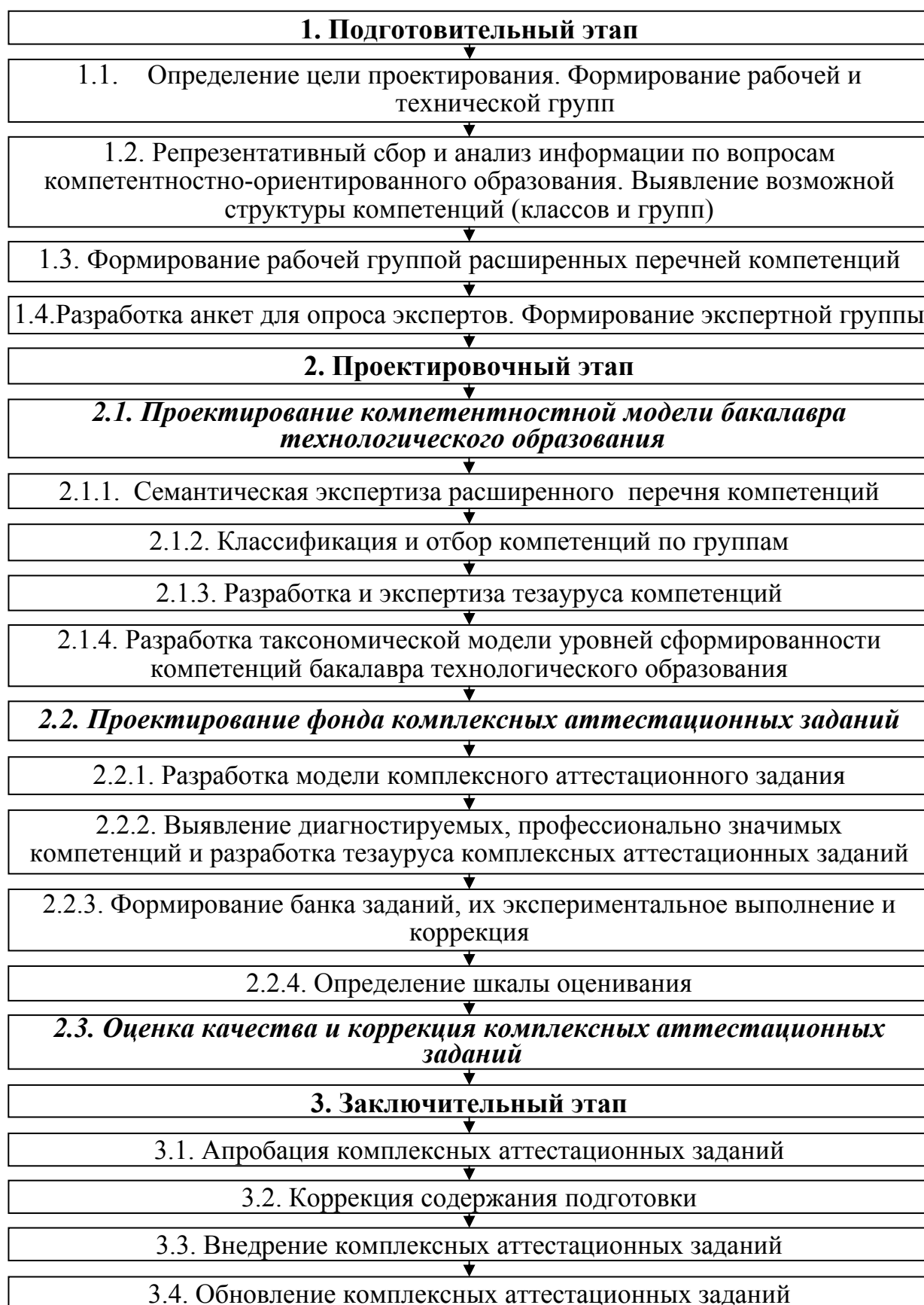
Рис. 2. Алгоритм проектирования комплексных аттестационных заданий