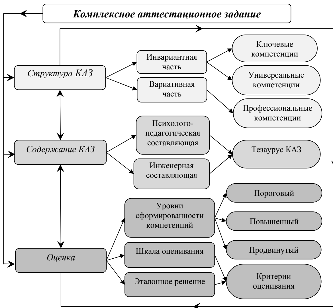
Рис. 4. Модель комплексного аттестационного задания

структуру, содержание и механизм оценивания уровней сформированности компетенций студентов.