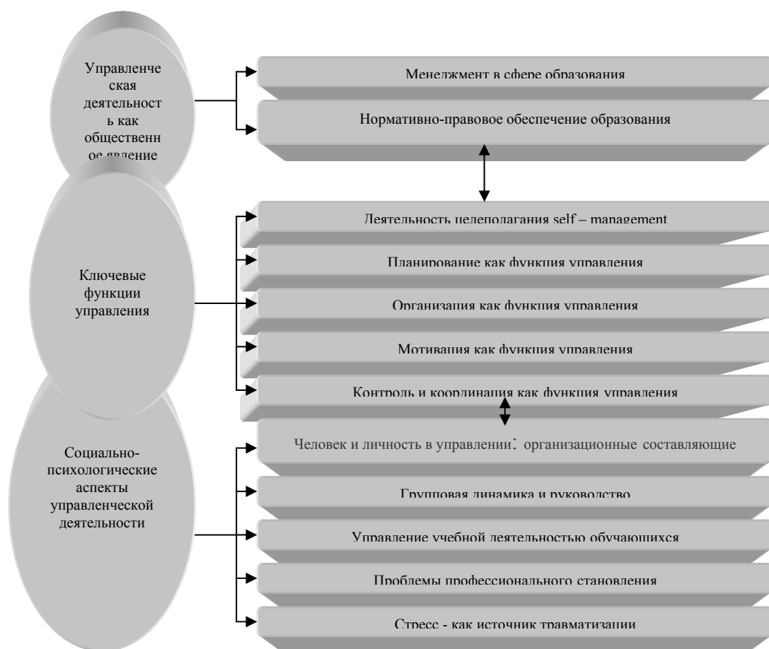
Рис. 1. Структурно-содержательная модель инновационной образовательной программы

Основной блок включает модули, отражающие ведущие функции управленческой деятельности в профессиональной деятельности учителя. Содержание данного блока позволяет участникам осознать необходимость