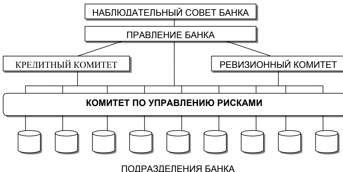
Рис. 5. Базовая структура организации подразделений банка

влияет на управление банковскими рисками. Для повышения эффективности их взаимодействия целесообразно ввести в структуру банка специализированный Комитет по управлению рисками, символизирующий в органиграмме «шину», для координации целей, управления и контроля уровня банковских рисков. Сам Комитет по управлению рисками должен быть подотчетен и напрямую подчиняться Правлению банка.