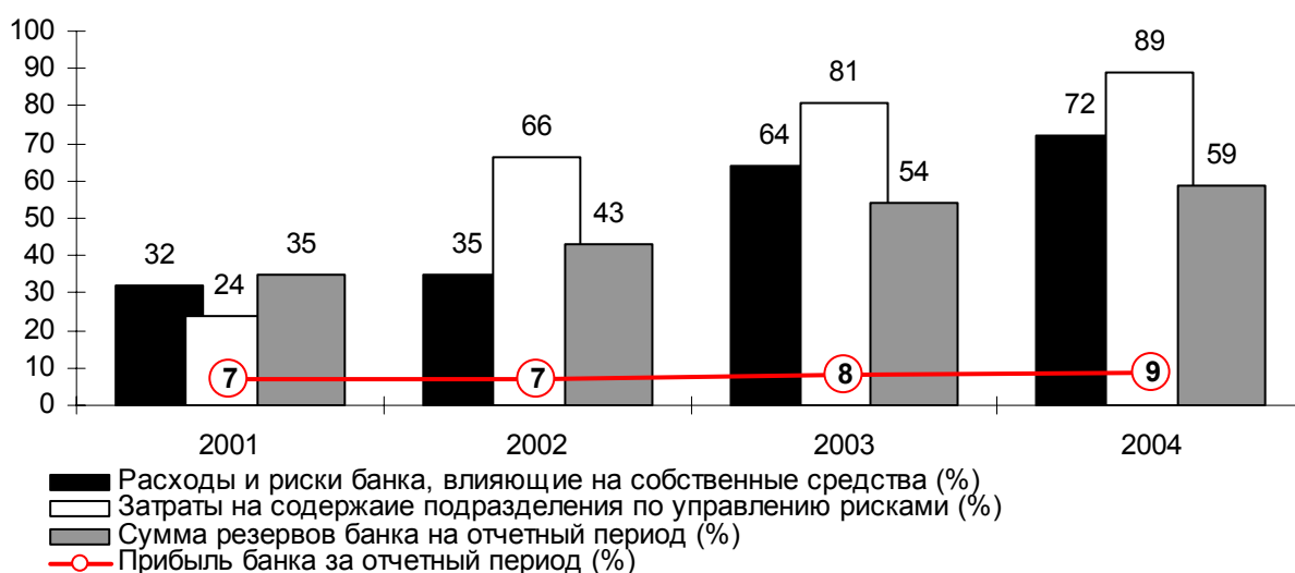
Рис. 4. Динамика фактических вложений в систему управления рисками по результатам деятельности Западно-Уральского банка Сбербанка РФ за отчетные периоды с 2000 по 2004 г.г. (% изменения за отчетный период)

Автором проведен анализ динамики фактических вложений в систему управления рисками на базе Западно-Уральского банка Акционерного коммерческого Сберегательного банка Российской Федерации в сравнении с ростом прибыли банка за отчетные периоды с 2000 по 2004 годы (рис.4.).