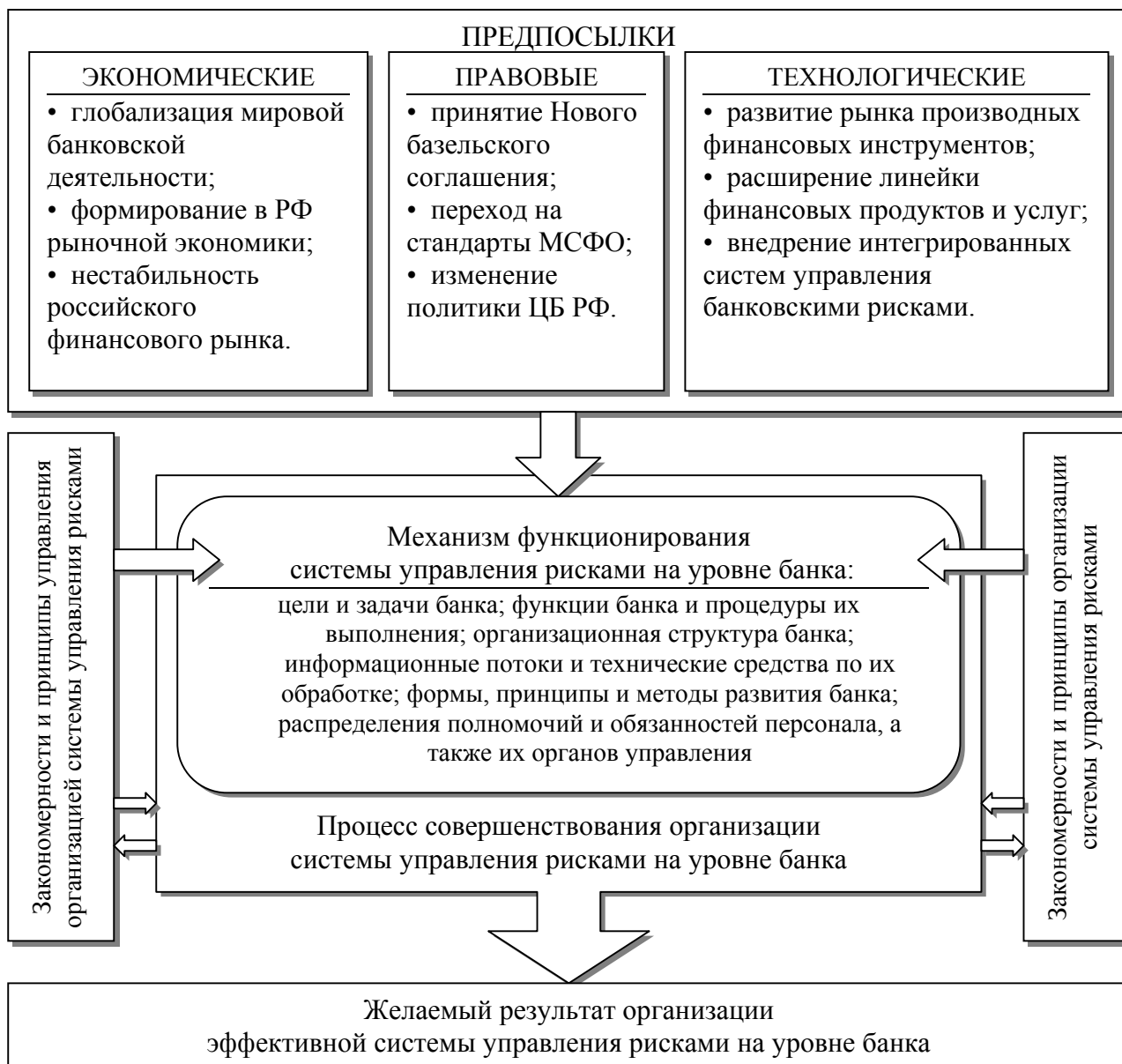
Рис. 3. Схема совершенствования организации системы управления рисками в банковской деятельности

В частности, особый интерес в рамках диссертационного исследования, имели следующие задачи концепции развития Акционерного коммерческого Сберегательного банка Российской Федерации: