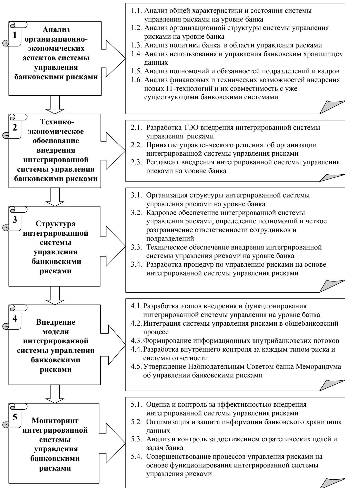
Рис. 6. Основные этапы и процедуры методики организации интегрированной системы управления рисками в банковской деятельности