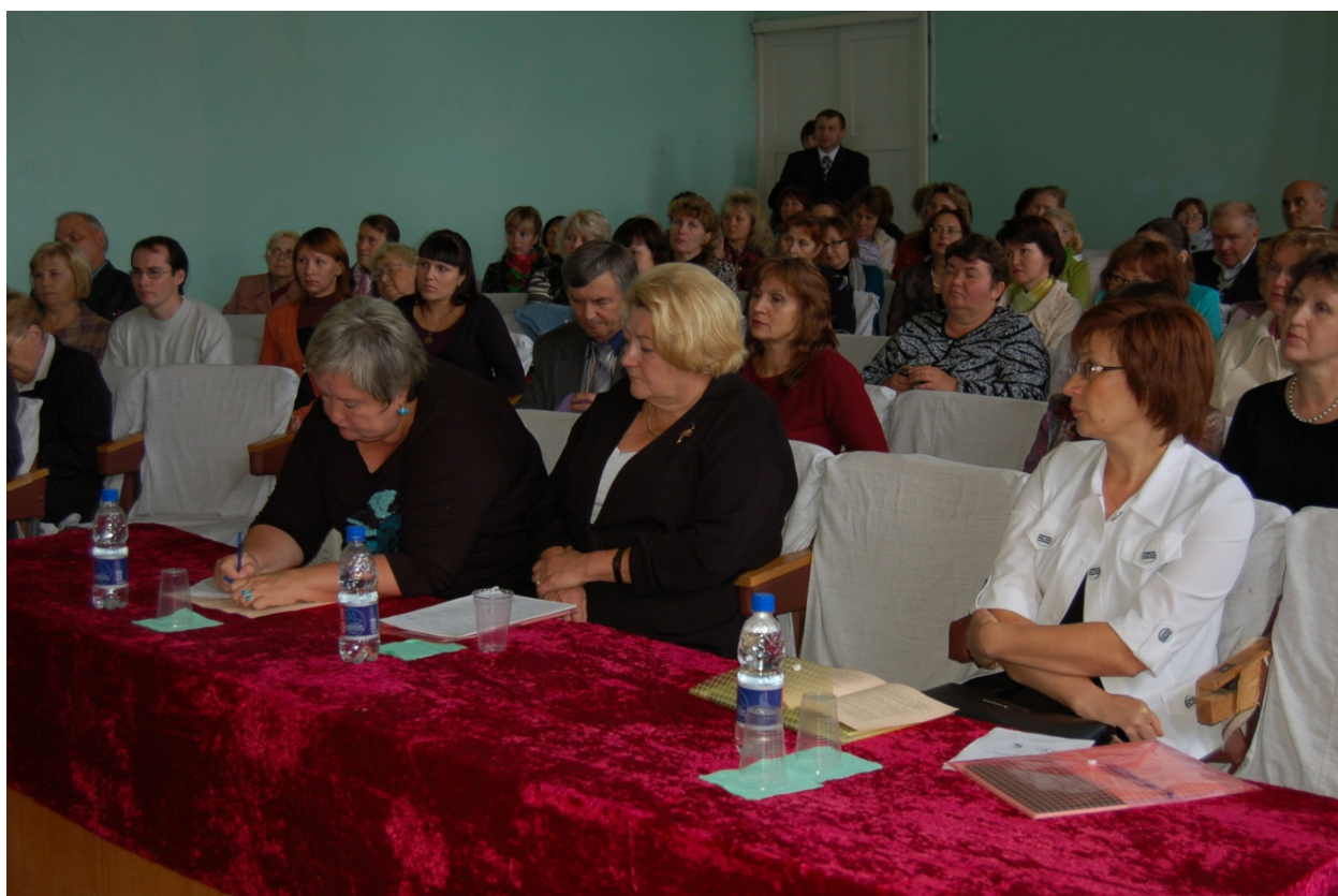
Работа круглого стола