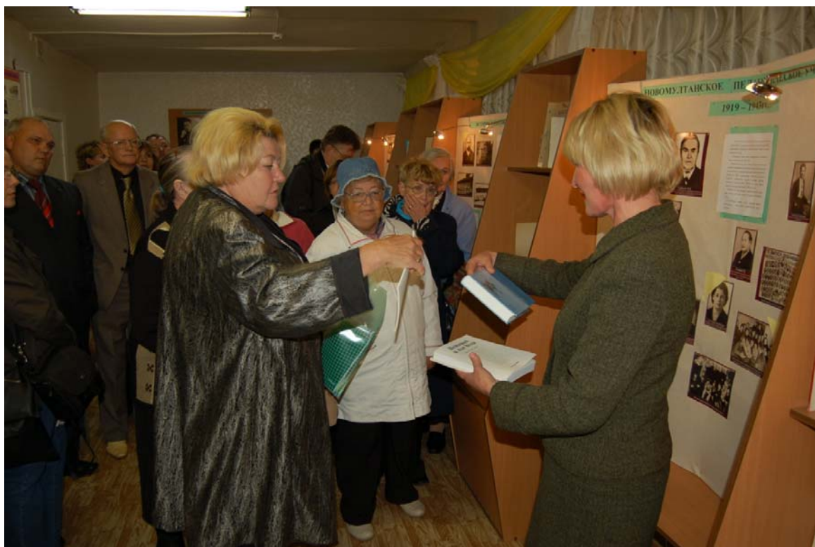
В Музее ГОУ СПО «Увинский профессиональный колледж»