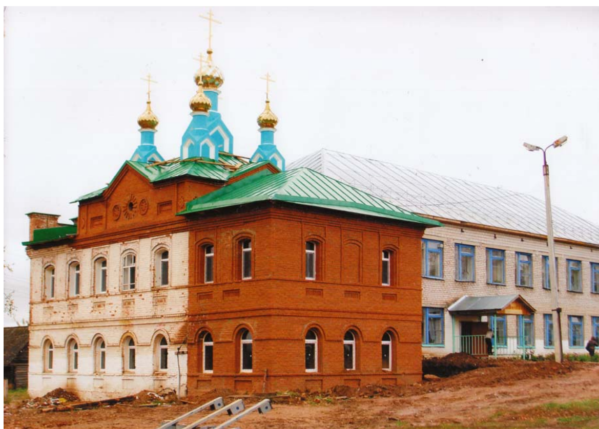
Храм Покрова Пресвятой Богородицы с. Новый Мултан