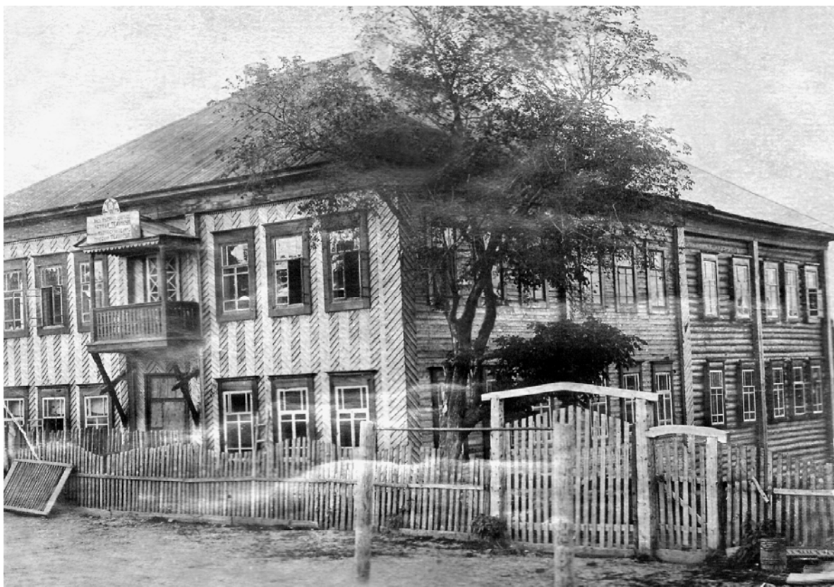
Здание Увинского педучилища в 1940-е гг.