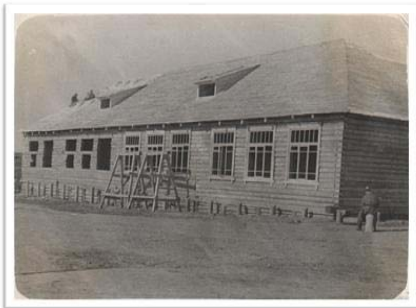
Строительство школы военнопленными в п. Рябово

Труд военнопленных использовался на торфоразработках, лесоповале. Одни бригады вырубали лес, на торфяных полях другие рыли каналы для осушения болот. Принимали участие в строительстве узкоколейной дороги поселок Башмур – поселок Рябово. До сих пор сохранились каналы, построенные военнопленными. Среди них два канала, берега которых укреплены бревнами. Каналы отводили воду с торфяных полей в реку Ува.