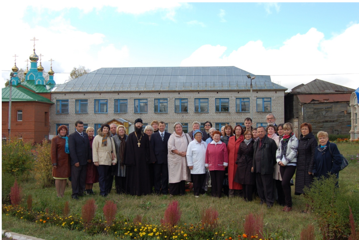
Участники круглого стола