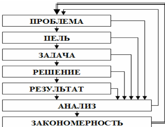
Рис. 1. Схема деятельности по решению проблемы

Подобный подход предполагает наличие определенных стратегий решения, особенности выбора которых подробно рассмотрены в работе.