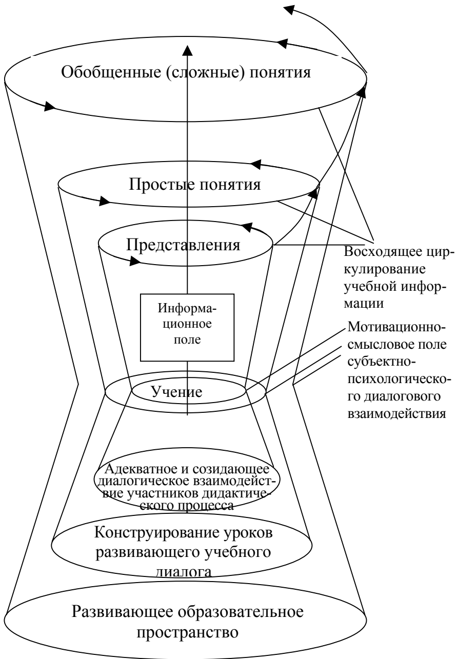
Рис. 1. Модель деятельности педагога в системе диалоговой технологии