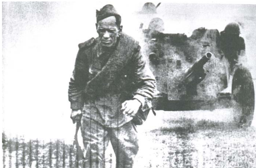
Рис. 5. В бой – на защиту Родины.

В то же время в массовом сознании произошло сочетание патриотизма отдельных народов с патриотизмом общесоюзным. Это отнюдь непростое сочетание осуществилось, благодаря наличию общего знаменателя – Советской власти.