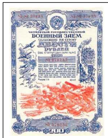
Рис. 21. Облигация IV гос. займа

Задачи перед органами НКВД и НКГБ. Для усиления этой системы в годы войны был задействован "вооруженный отряд партии" – органы НКВД – НКГБ СССР через реализацию военно-репрессивной и охранительной функций. Основное препятствие в решении задач сельского хозяйства органы госбезопасности видели не только и не столько в объективных трудностях, связанных с войной, сколько в субъективных причинах – в засорении колхозов враждебными элементами, в необходимости их разоблачения и обезвреживания их подрывной деятельности.