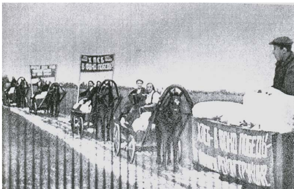
Рис. 15. Идет сверхплановый хлеб для фронта

Хлебозаготовки. В предвоенном 1940 г. колхозы округа сдали государству 28,5 тыс. т. зерна. В последующие годы объемы производства и сдачи государству возрастали, несмотря на то, что колхозники уходили на фронт, а в колхозах осталось все меньше и меньше рабочих рук. Валовые сборы зерна возрастали, в основном, за счет расширения посевных площадей, а объемы продаж за счет увеличения товарности. В округе оставалось все меньше продовольственного и фуражного зерна. Этого требовала война, и достигалось путем установления жесткой военной дисциплины с одной стороны и осознанием колхозниками той опасности, которая нависла над страной.