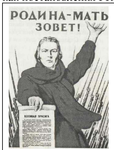
Рис. 1. Родина – мать зовёт!

В первые дни войны решения о перестройке страны оформлялись как совместные решения ЦК ВКП(б) и СНК СССР и Указы ПВС СССР. С образованием ГКО была осуществлена полная централизация власти. Единоличная диктатура получила завершение и полное законодательное закрепление. Все вопросы государственного значения решались в узком кругу доверенных лиц, привлекая консультантов по своему усмотрению. Даже важнейшие решения нередко принимались без обсуждения, единолично, что вело к крупным ошибкам, особенно в первый период войны. Принятые решения, в зависимости от их содержания, оформлялись как постановления ГКО, Политбюро ЦК ВКП(б), СНК СССР и ЦК ВКП(б),