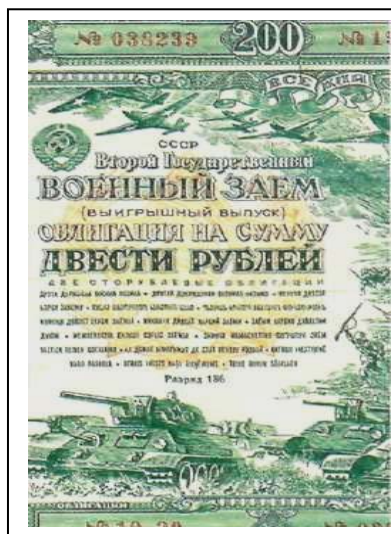
Рис.19. Облигация II гос. займа

Полвинского сельского совета – на 470 рублей, Сервинского сельского совета – на 285 рублей. Труженики колхоза «Красноармеец» Юрлинского района внесли облигаций на 13 175 рублей 216 .