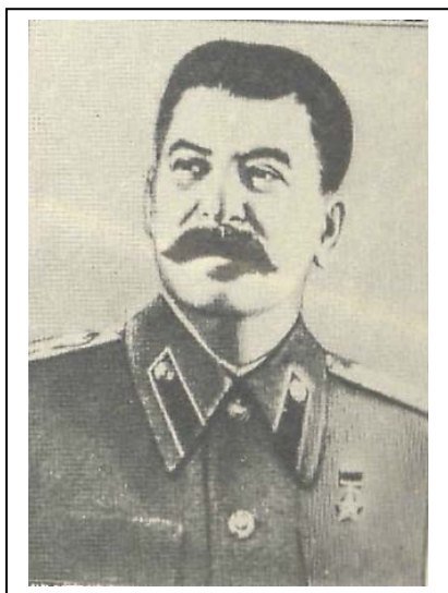
Рис. 3. И.В. Сталин.

государственную машину и всю страну. Это практическая сторона. Но есть и другая – психологическая. В военных условиях важен был Сталин, как организатор, в руках которого сосредотачивались все бразды правления, а держал он их достаточно твердо. Однако не менее важен был Сталин, как символ незыблемости государственной власти, твердости руководства, уверенности в победе, решимости одолеть врага, единства различных народов и различных слоев народа.