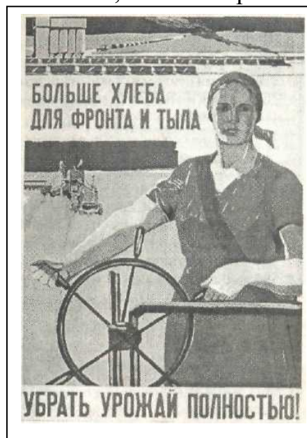
Рис. 13. Плакат «Больше хлеба»

В целях повышения урожайности, в годы войны колхозы заботились о районированных сортах зерновых культур. С этой целью были определены 6 колхозов-райсемхозов. Среди них колхозы: «Восход» Юрлинского района – план закладки сортовых семян 1000 ц, «Труженик» Кудымкарского района – 800 ц, «Совет» – 720 ц, «Заря будущего» Юсьвинского района – 240 ц и им. Литвинова Косинского района – 240 ц. В этих хозяйствах, как правило, урожайность составляла 12-13 ц/га. После обработки семена распространялись в соседние хозяйства. В 1943 г. в этих семенных хозяйствах был получен хороший урожай, и уборочные работы в округе, в основном, были завершены к 25 сентября 104 .