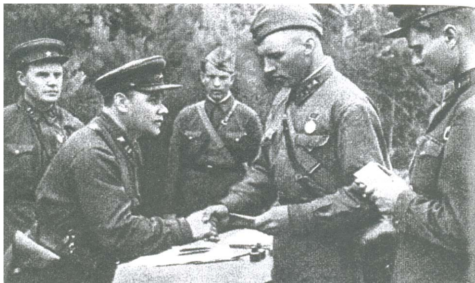
Рис. 2. Вручение партийного билета

коммунистов (к концу войны 3,3 млн. человек) находились в рядах Вооруженных Сил 1 . Те, кто вступал в эти годы в партию, не мог, разумеется, рассчитывать на какие-то привилегии. Право стать коммунистом определялось только одним – поведением в бою. Не случайно в это время были фактически сняты прежние ограничения на вступление в партию для детей кулаков, священников и т.д., а кандидатский стаж сокращен до трех месяцев.