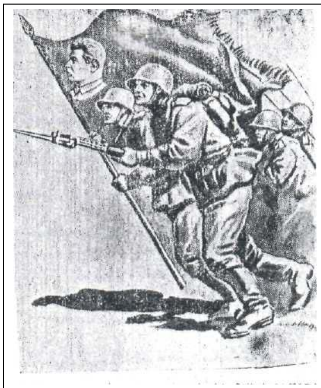
Рис. 6. В бой со Сталиным

Так писал потрясенный И.Сельвинский в январе 1942 г. у Керченского рва, где были свалены около семи тысяч трупов детей, стариков, старух. Безусловно, гитлеровцы обращались с населением захваченных русских областей куда более жестоко, чем, скажем, с французами или чехами. Но и там безжалостность врага породила неутраченный гнев. В Советском Союзе были сожжены тысячи деревень, уничтожены миллионы мирных граждан, подверглись бомбардировкам сотни больших и малых городов.