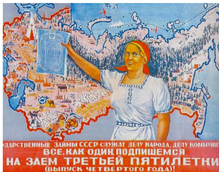
Рис. 20. Плакат «Подпишись на III государственный заем»

Подписывались даже пенсионеры и школьники. Так, 62-летние колхозники Г. Зырянов и П. Аликин внесли наличными по 100 рублей 220 . По округу заем 1942 г. был собран на 108% к плану, а Кудымкарский и Юрлинский районы выполнили план на 123%.