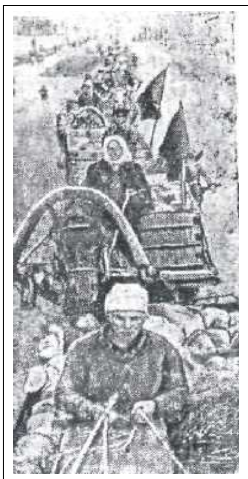
Рис. 14. Обоз с зерном для фронта