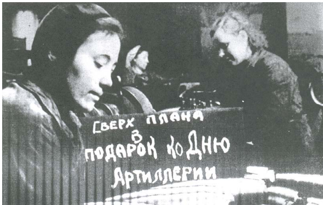
Рис. 18. Сверхурочная работа для перечисления зарплаты в фонд строительства боевой техники

– 24 тысячи рублей передали на строительство танковой колонны имени ВЛКСМ.