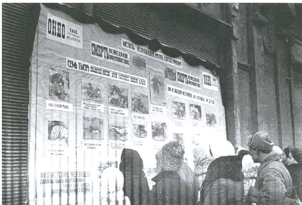
Рис. 11. Жители округа у Окна Тасс

Прием эвакуированного населения. Эвакуированное население, имеющее разнородный национальный и социальный состав, в сознании людей воспринималось, как особая специфическая категория населения.