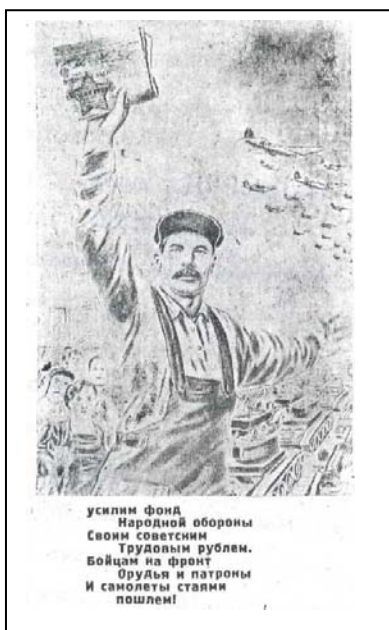
Рис. 16. Плакат «Сдадим средства в Фонд обороны»

колхозах ими заработано 4 тысячи трудодней и более 14 тысяч рублей на других предприятиях. Все эти продукты и деньги были переданы в Фонд обороны страны. Коллектив Булатовского мехлесопункта в 1941 г. внес также 36,6 тысяч рублей 187 . Комсомольцы и молодежь Белоевского района с 17 августа по 7 сентября 1941 г. провели 14 воскресников, в которых приняли участие около 4 тысяч человек 188 .