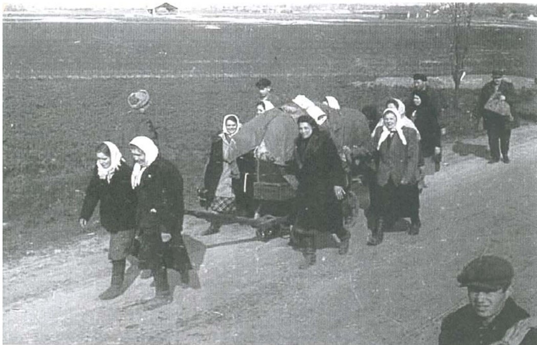
Рис. 12. Эвакуация населения

немцев было размещено на Урале, промышленность которого испытывала острую потребность в рабочей силе. Они работали на предприятиях угольной, лесной промышленности, в строительных организациях. Наиболее сложным периодом в трудармии было время с осени 1941 по 1943 гг. С 1944 г. условия содержания трудармейцев несколько улучшились. Однако тяжелая физическая работа, сложные бытовые условия, скудное питание, болезни, вкпе с суровыми зимами 1942 и 1943 гг. часто приводили людей к гибели.