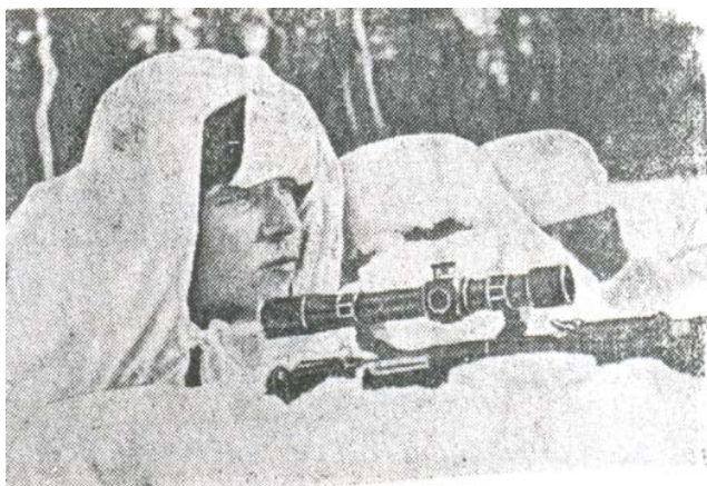
Рис. 7. Бойцы истребительного батальона в дозоре

Военная подготовка. Еще до начала войны по секретному указанию облвоенкомата 12 мая 1941 г. в округе была проведена мобигра. Итоги этой "мобилизации" были крайне неудовлетворительными 32 . С этого момента партийные, советские органы и окрвоенкомат начали работу по обучению населения действиям в условиях войны. Однако такая работа оказалась запоздалой. 22 июня началась Великая Отечественная война. В 10 часов утра бюро окружкома партии приняло мобилизационное задание для районов и довело его телеграммами до РК ВКП(б), 23 июня в 6 часов утра во всех райкомах партии были проведены заседания бюро, а в 14 часов в райцентрах, на центральных усадьбах колхозов и предприятиях было решено провести митинги с объявлением начала войны и мобилизации 33 . Весь актив округа и районов выехал на митинги.