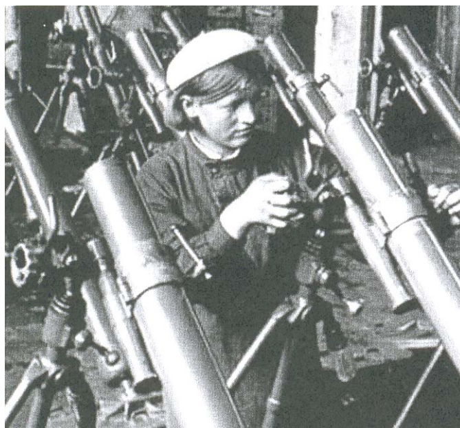
Рис. 9. На учебных сборах

Из местных ресурсов пополнялась и материальная база учебных пунктов. Эта работа шла под руководством местных Советов. Исполком окрсовета 27 ноября 1941 г. решением "О производстве гранат "Ф-1" обязал артель "Красный молот" немедленно приступить к изготовлению гранат, установил план их выпуска на декабрь. 12 апреля 1942 г. утвержден план изготовления черенков для пехотинских лопат на II квартал. 24 августа 1942 г. принимается решение "О производстве лыж для НКО артелью "Красный подеревщик" 42 . Часть продукции направлялась на пункты, остальные – на фронт. Конкретные меры принимались и в районах. Только в Кудымкарском промкомбинате за III квартал 1941 г. изготовили 102 макета-винтовки, 117 макетов-гранат 43 .