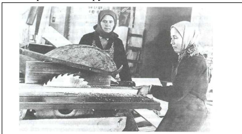
Рис. 4. Женщины в артели «Красный подеревщик»

С момента образования промартелей началась подготовка специальных кадров. Вначале были собраны специалисты – практики из колхозов, бывшего Кувинского завода, позже стали готовить специально из числа молодежи. С уходом специалистов и высококвалифицированных рабочих на фронт их места занимали жены, сестры и сыновья, которых снова надо было учить. Обучали на курсах и на рабочих местах. Самым трудным был 1942 г. – это видно из таблицы, когда резко упали объемы производства и производительность труда. В 1943 и 1944 гг. артели настроились на работу в условиях военного времени, наладили подготовку резерва кадров, и объемы производства и качество стали стабильными, что обеспечило военные заказы и внутренние потребности округа.