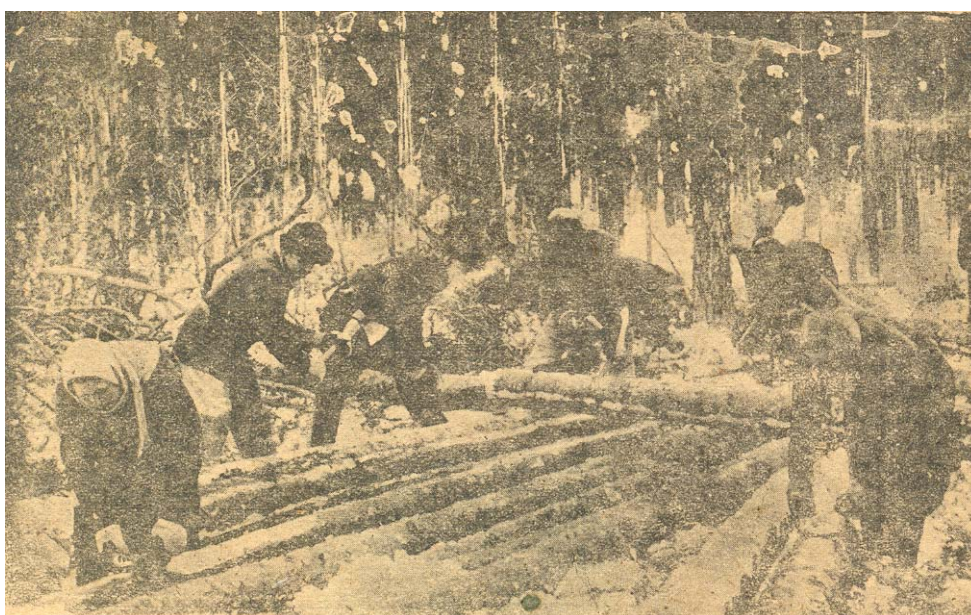
Рис. 3. Колхозники на лесозаготовках