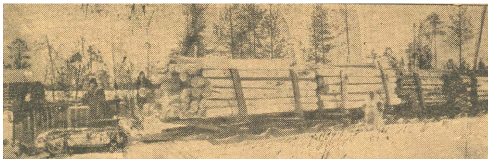
Рис. 1. Вывозка древесины

Лесная промышленность в округе в годы войны являлась ведущей отраслью. Наличие больших лесосырьевых ресурсов с годичной лесосекой 3550 тыс. куб. метров древесины в год, прилегающих к Каме и ее притокам, позволили быстрыми темпами развить эту отрасль. Основными лесозаготовителями являлись 12 предприятий треста «Комипермлес»: в Гайнском районе – Булатовский МЛП † и Гайнский ЛПХ, в Косинском – Косинский ЛПХ, в Кочевском – Кочевский ЛПХ, в Юрлинском – Юрлинский ЛПХ, в Белоевском – Эрнский ЛПХ и Велвинский МЛП, в Кудымкарском – Самковский ЛПХ и Визяйский МЛП, в Юсьвинском – Тукачевский и Крохалевский МЛП и Доеговский ЛПХ.