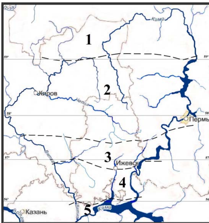
Рис. 1. Карта-схема зонального ботанико-географического подразделения ВКМ 2

Условные обозначения: Таяжная зона: 1 – подзона средней тайги; 2 – подзона южной тайги. Подтаяжная зона (смешанных лесов): 3 – подзона хвойно-широколиственных лесов (“липовых раменей”); 4 – подзона широколиственно-хвойных лесов (“орешниковых раменей”); 5 – территория, переходная к северной лесостепи. Границы и названия выделов даны с учетом работ А.Д. Фокина [1929], Л.А. Зубаревой [1997], С.А. Овеснова [1997], В.А. Шадрина [1999], О.Г. Барановой [2000, 2002], О.Г. Барановой, И.Е. Егорова, В.И. Стурмана [2010].