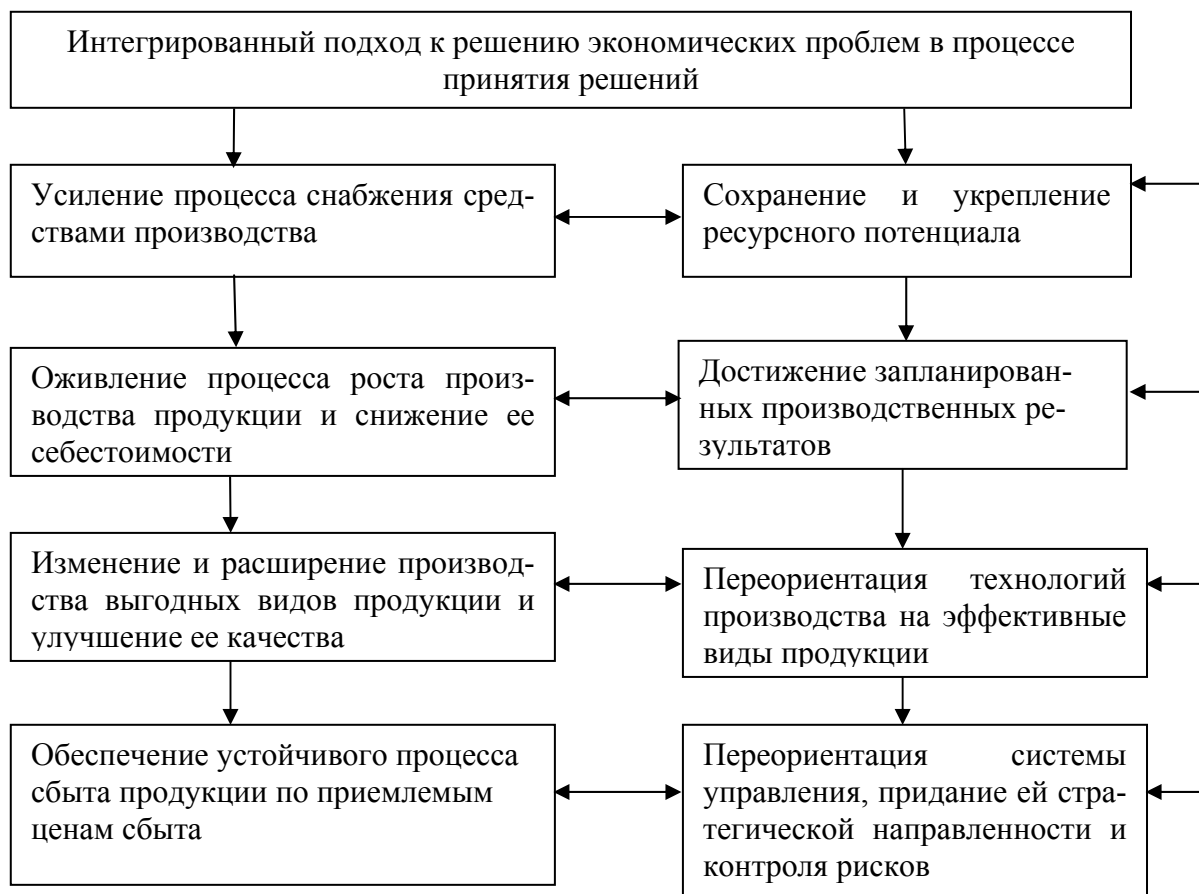
Рис. 1. Стратегические задачи устойчивости развития сельскохозяйственной организации

Она позволит предупреждать возможные негативные тенденции, эффективно использовать ограниченные материальные и финансовые ресурсы, проводить последовательную управленческую политику по стратегии развития сельскохозяйственных организаций и их финансового оздоровления.