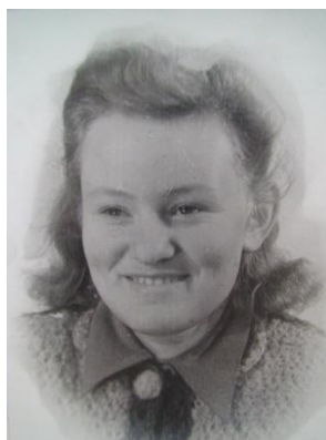
Такими они встретились