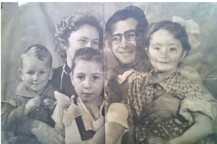
Семья – 1962 г.