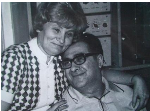
Отцу - 55 лет