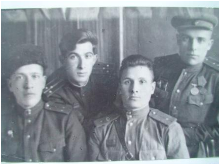
На фронте – второй слева.